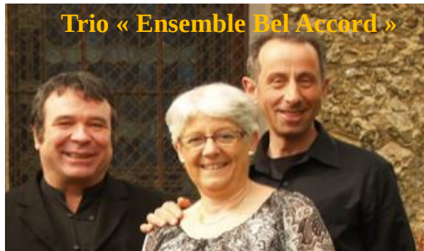
Trio « Ensemble Bel Accord »

Le 18 septembre, lors des Journées du Patrimoine, l'église du Vieux-Bourg a accueilli le trio « Ensemble Bel Accord » pour un concert de chants Renaissance.